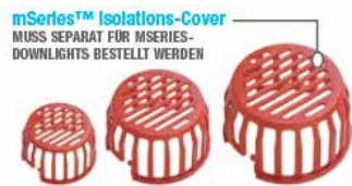
50mm / 53mm / 72mm Isolationscover für mSeries Downlights

MUSS SEPARAT FÜR MSERIESDOWNLIGHTS BESTELLT WERDEN mSeries™ Isolations-Korb Austauschbare 60°LEDchroic™ Linse 60° Die austauschbaren Linsen sind nur kompatibel mit Fixed, Baffle, Notlicht, Farbe Xchange, RGB & Trimless m10. 40° standardmäßige Lieferung!