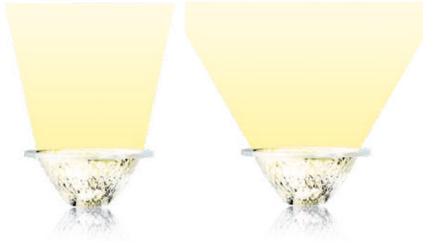
Austauschbare 24° LEDchroic™ Linse